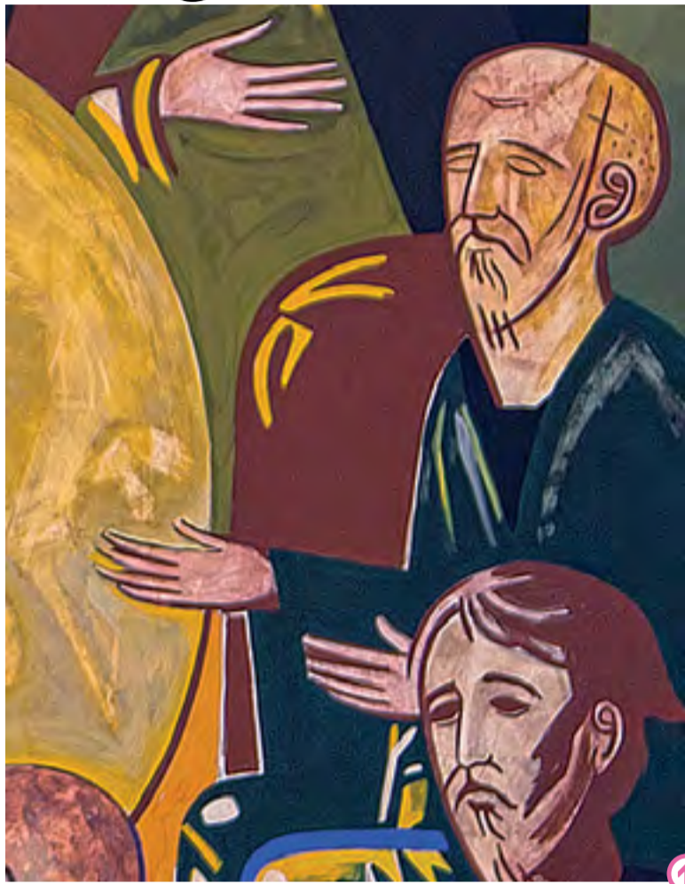
OSTATNIA WIECZERZA. FRAGMENT IKONY Z SEMINARIUM RM W WARSZAWIE. KIKO ARGÜELLO

J EZUS PRZECHODZĄC UJRZAŁ PEWNEGO CZŁOWIEKA, NIEWIDOMEGO OD URODZENIA. UCZNIOWIE JEGO ZADALI MU PYTANIE: «RABBI, KTO ZGRZESZYŁ, ŻE SIĘ URODZIŁ NIEWIDOMYM – ON CZY JEGO RODZICE?» JEZUS ODPOWIEDZIAŁ: «ANI ON NIE ZGRZESZYŁ, ANI RODZICE JEGO, ALE [STAŁO SIĘ TAK], ABY SIĘ NA NIM OBJAWIŁY SPRAWY BOŻE. POTRZEBA NAM PEŁNIC DZIEŁA TEGO, KTÓRY MNIE POŚLAŁ, DOPÓKI JEST DZIEŃ. NADCHODZI NOC, KIEDY NIKT NIE BĘDZIE MÓGŁ DZIAŁAĆ. JAK DŁUGO JESTEM NA ŚWIECIE, JESTEM ŚWIATŁOŚCIĄ ŚWIATA». TO POWIEDZIAWSZY SPLUNĄŁ NA ZIEMIĘ, UCZYNIŁ BŁOTO ZE ŚLINY I NAŁOŻYŁ JE NA OCZY NIEWIDOMEGO, I RZEKŁ DO NIEGO: «IDŹ, OBMYJ SIĘ W SADZAWCE SILOAM» – CO SIĘ TŁUMACZY: POŚLANY. ON WIĘC ODSZEDŁ, OBMYŁ SIĘ I WRÓCIŁ WIDZĄC. A SĄSIEDZI I CI, KTÓRZY PRZEDTEM WIDYWALI GO JAKO ŻEBRAKA, MÓWILI: «CZYŻ TO NIE JEST TEN, KTÓRY SIEDZI I ŻEBRZE?» JEDNI TWIERDZILI: «TAK, TO JEST TEN», A INNI PRZECZYLI: «NIE, JEST TYLKO DO TAMTEGO PODOBNY». ON ZAŚ MÓWIŁ: «TO JA JESTEM». MÓWILI WIĘC DO NIEGO: «JAKŻEŻ OCZY CI SIĘ OTWARĘY?» ON ODPOWIEDZIAŁ: «CZŁOWIEK ZWANY JEZUSEM UCZYNIŁ BŁOTO, POMAZAŁ MOJE OCZY I RZEKŁ DO MNIE: „IDŹ DO SADZAWKI SILOAM I OBMYJ SIĘ”. POSZEDŁEM WIĘC, OBMYŁEM SIĘ I PRZEJRZAŁEM. (J 9,1-11)