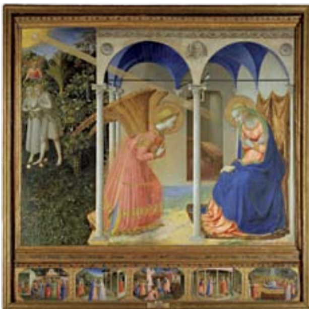
ZWIASTOWANIE OBRAZ OŁTARZOWY NAMALOWANY OK. 1426 PRZEZ FRA ANGELICO DLA KLASZTORU SANTO DOMENICO W FIOLE, K. FLORENCJI. TEMPERA NA DESCE. OBRAZ WRAZ Z OŁTARZEM OBECNIE ZNAJDUJE SIĘ W MUZEUM W PRADO.