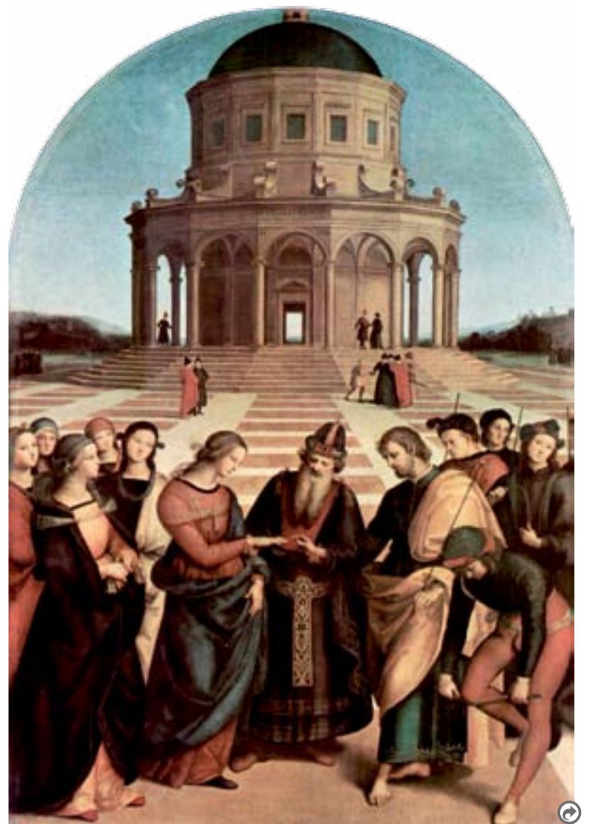
ZASŁUBINY MARI I JÓZEFEM – OBRAZ RAFAELA SANTIAGO ZNANY TAKŻE JAKO ZASŁUBINY MARI I. 1504 R. OLEJ NA DESCE, 170 X 118 CM. OBECNIE W MEDIOLAŃSKIEJ PINACOTECA DI BRERA.

powinna prowadzić do prawdziwego nawrócenia i odnowy życia. Ma ona na celu uświadomienie wiernym właściwego rozumienia grzechu jako zniewagi Boga, jego społecznych skutków i konieczności modlitwy za grzeszników (por KL 109). Do najbardziej znanych form wielkopostnej pokuty należą: post modlitwa i jałmużna: „wyrażają one nawrócenie w