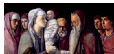
GIOVANNI BELLINI, OFIAROWANIE PAŃSKIE (1460-1464) FONDAZIONE QUERINI STAMPALIA, WENECJA

W nawiązaniu do tych słów artyści malowali Dzieciątka opromienione cudownym światłem, ale także bardzo często zapalone świece w rękach osób asystujących obrzędowi. Począwszy od IX wieku wierni w dzień Święto Ofiarowania przynosili do kościoła do pobłogosławienia świece zwane gromnicami. (Nazwa ta wywodzi się od słowa „grom”, ponieważ podczas burzy stawiano te świece w oknie, zapalano i modlono się o oddalenie piorunów.) Niedługo ważne było, aby donieść palącą się świecę do domu. Po powrocie wypalano płomieniem gromnicy krzyż na belce sufitu. Tę gromnicę wkładano też w ręce umierającego, aby stanowiła ochronę przed napaścią złych duchów.