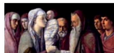
GIOVANNI BELLINI, OFIAROWANIE PAŃSKIE (1460-1464) FONDAZIONE QUERINI STAMPALIA, WENECJA

W nawiązaniu do tych słów artyści malowali Dzieciątka opromienione cudownym światłem, ale także bardzo często zapalone świece w rękach osób asystujących obrzędowi. Począwszy od IX wieku wierni w dzień Święto Ofiarowania przynosili do kościoła do pobłogosławienia świece zwane gromnicami. (Nazwa ta wywodzi się od słowa „grom”, ponieważ podczas burzy stawiano te świece w oknie, zapalano i modlono się o oddalenie piorunów.) Niedługo ważne było, aby donieść palącą się świecę do domu. Po powrocie wypalano płomieniem gromnicy krzyż na belce sufitu. Tę gromnicę wkładano też w ręce umierającego, aby stanowiła ochronę przed napaścią złych duchów.