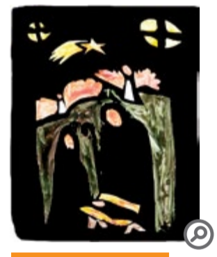
MAŁY TAK JAK KROMKA CHLEBA

Potem zostawili wszystko i pomimo zaawansowanej ciąży Maryi, ruszyli w długą drogę do Betlejem na spis ludności. Bezskuteczne poszukiwali bezpiecznego i wygodnego noclegu, poród w samotności w grocie, odwiedziły pasterzy, ludzi z kpiarską reputacją, ucieczka do Egiptu, ogołocenie ze wszystkiego: z marzeń o szczęśliwej wielodzietnej rodzinie, z dobytku.