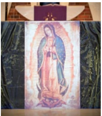
PANNA Z GUADALUPE

W OKRESIE ADWENTU WOKÓŁ NAS WIDZIELIŚMY wiele symboli przypominających o narodzinach Chrystusa. Jednym z nich jest obraz Matki Bożej z Guadalupe, który w naszym kościele umieszczony jest przed ołtarzem. Historia tego dzieła sięga roku 1531, kiedy to podczas silnego przesładowania w Meksyku biednemu Juan Diego objawiła się Matka Boża. Zwróciła się do niego z prośbą, aby wybudował ku jej czci kapliczkę, która byłaby miejscem pojednania zwaśnionych narodów. Biskup, nie dając wiary opowieściom Juan Diego, nie zgodził się mu pomóc. Indianin doświadczył kolejnego objawienia, kiedy to Matka Boska na środku pustyni usypała przed nim łąkę z kwiatów róż. Ponownie udał się do swojego biskupa i w obecności wielu świadków rozsypał kwiaty na ziemię. Na jego szacie ukazał się także wizerunek brzemiennej Maryi z namalowanymi na jej czole i policzkach tradycyjnymi symbolami indiańskimi, będącymi znakiem jej utożsamienia się z cierpiącymi i przesładowanymi. Skruszony biskup upadł na kolana i ze łzami przeproszał Maryję za swe niedowierzanie. Dziecko, które Maryja nosi pod sercem, przypomina o rychłym pojawieniu się Syna Bożego, na którego my, wierni, cierpliwie czekamy. Wspomnienie liturgiczne Najświętszej Maryi Panny z Guadalupe przypada 12 grudnia. (KK i NL)