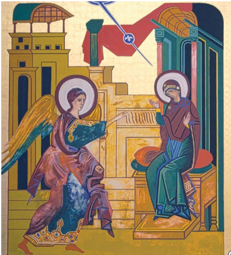
ZWIASTOWANIE NAJŚWIĘTSZEJ MARYI PANNY – IKONA KIKO ARGUELLO. SEMINARIUM REDEMPTORIS MATER W WARSZAWIE

A NIOŁ RZEKŁ DO JÓZEF: NIE BÓJ SIĘ! Każdy z nas żyje wśród tylu zawirowań budzących lęk. Każdy ma swoje zmagania życiowe: starzy mówią: choroby, drożyzna, mała renta. Młodzi mówią: kiepska, ciężka praca, małe mieszkanie bądź jego brak, a jeszcze żona spodziewa się dziecka w nie najlepszym momencie... Brzmi jakby znajomo... Smutki Józefa i Maryi były do naszych bardzo podobne. Ale zarówno do Maryi, jak i do Józefa przychodzi anioł i mówi te same słowa: „Nie bój się!” Tak Maryja, jak i Józef mieli wątpliwości. Ale za każdym razem spotkanie ze słowem pocieszenia i obietnicą Ducha Świętego napełniały ich odwagą. Każdego dnia do nas też Bóg kieruje swojego anioła i swoje Słowo, bo zna nasze niepewności. I chce nam powiedzieć: „Nie bój się! Ja będę z tobą”. Chcesz usłyszeć ten głos? To przychodź tam, gdzie jest ono głoszone, do wspólnoty Kościoła. Tutaj też spotkasz Maryję, Matkę Kościoła, która pierwsza słucha Słowa. Zaprosz ją do siebie, by ci przyniosła Jezusa, który rozprasza każdy lęk.