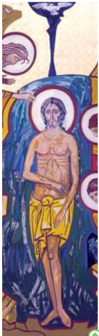
CHRZEST JEZUSA, KIKO ARGÜELLO.

I RZEKŁ: «OTO BARANEK BOŻY, KTÓRY GŁADZI GRZECH ŚWIATA. TO JEST TEN, O KTÓRYM POWIEDZIAŁEM: PO MNIE PRZYJDZIE MAŻ, KTÓRY MNIE PRZEWYŻSZYŁ GODNOŚCIĄ, GDYŻ BYŁ WCZEŚNIEJ ODE MNIE. JA GO PRZEDTEM NIE ZNAŁEM, ALE PRZYSZEDŁEM CHRZCIĆ WODĄ W TYM CELU, ABY ON SIĘ OBJAWIŁ IZRAELOWI». JAN DAŁ TAKIE ŚWIADECTWO: «UJRZAŁEM DUCHA, KTÓRY ZSTĘPOWAŁ Z NIEBA JAK GOŁĘBICA I SPOCZAŁ NA NIM. JA GO PRZEDTEM NIE ZNAŁEM, ALE TEN, KTÓRY MNIE POŚLAŁ, ABYM CHRZCIŁ WODĄ, POWIEDZIAŁ DO MNIE: „TEN, NAD KTÓRYM UJRZYSZ DUCHA ZSTĘPUJĄCEGO I SPOCZYWAJĄCEGO NA NIM, JEST TYM, KTÓRY CHRZCI DUCHEM ŚWIĘTYM”. JA TO UJRZAŁEM I DAJĘ ŚWIADECTWO, ŻE ON JEST SYNEM BOŻYM». (J 1,29-34)